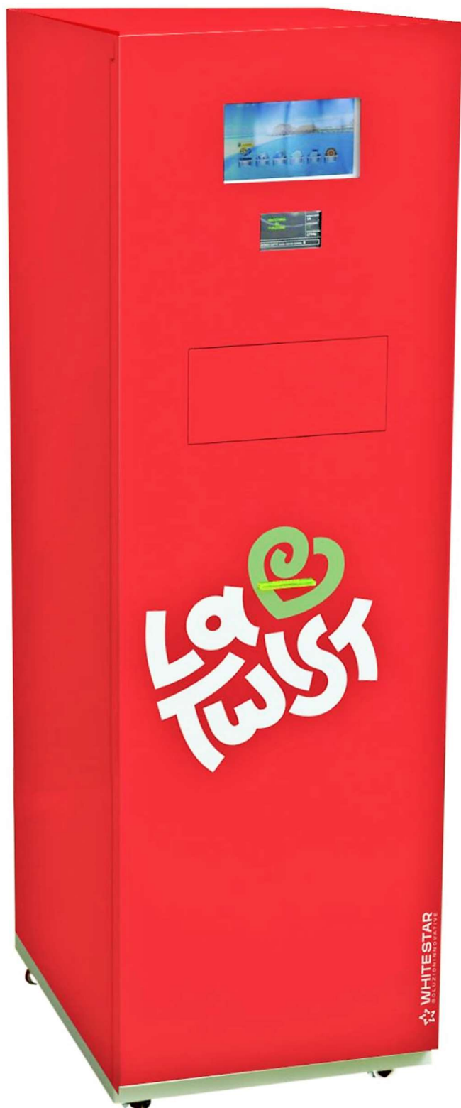
La macchina separacapsule La Twist_Rosso di WHITESTAR