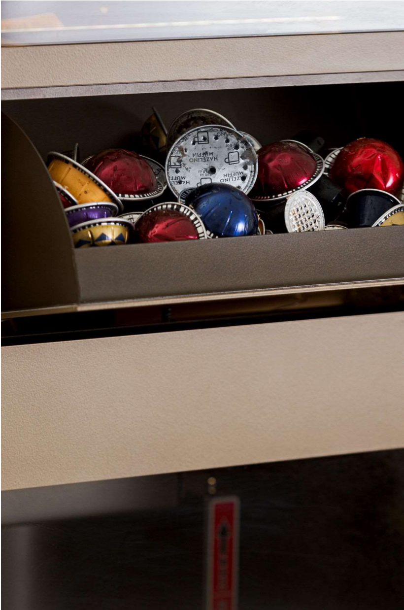
Dettaglio macchina separacapsule La Twist di WHITESTAR