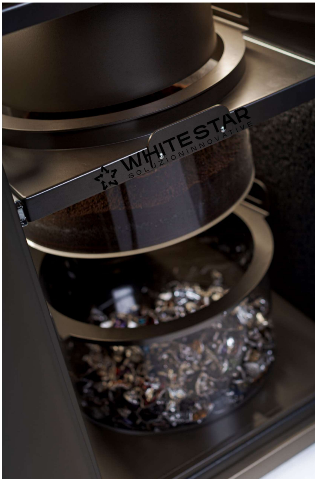
Vista interno della macchina separacapsule LaTwist di WHITESTAR destinata ai coffee shop e ai negozi specializzati